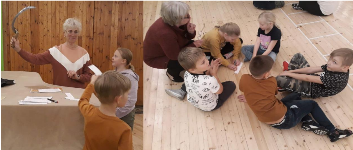
Algklasside lõikuspeo viktoriin.