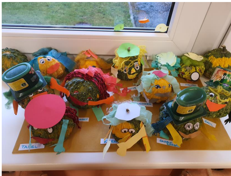
Lasteaiarühma Jõmmu laste valmistatud kõrvitsa fantaasiategelased.

Samuti Jõmmu lasteaiarühma lapsed pidasid oma kõrvitsapidu. Lastel valmisid kõrvitsad-fantaasiategelased, kus iga laps rakendas oma loovust. Tulid vahvad tegelased!