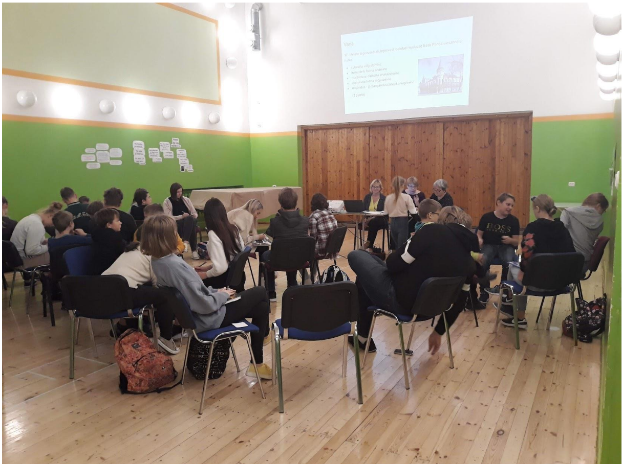
Põhikooli 4.-9. klasside veerandilõpuviktoriin.