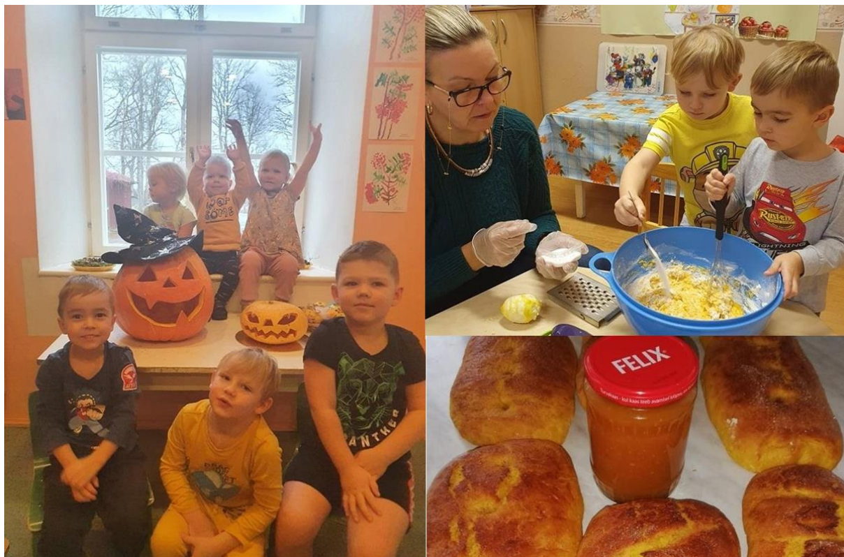
Lasteaiarühma Lustilaps Halloween'i kõrvitsad, kõrvitsa saiakesed ja -moos.

Lustilapse rühmas meisterdati vahvaid Halloweeni kõrvitsaid ja et midagi raisku ei läheks, siis sisust küpsetati saiad ja tehti moosi.