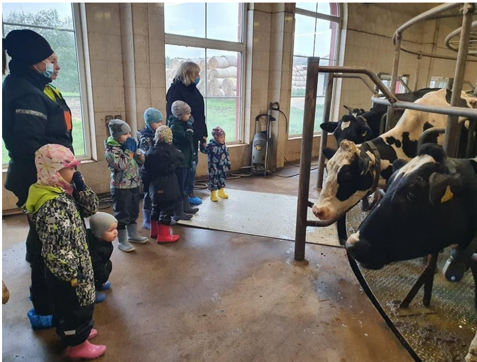
Lasteaiaühma Lustilaps lapsed ja õpetajad lüpsmise protsessi jälgimas.

Usinasti toimetatakse ka lasteaiaühmades. Kabala Lasteaed-Põhikooli Lustilaste rühma sügis on olnud teguderohke. Külas käidi Raikküla Farmeri Allika laudas. Karusellil olid lehmad lüpsmiseks valmis ja lapsed vaatasid seda vahvat seadeldist: keerlevat lüpsimasinat.