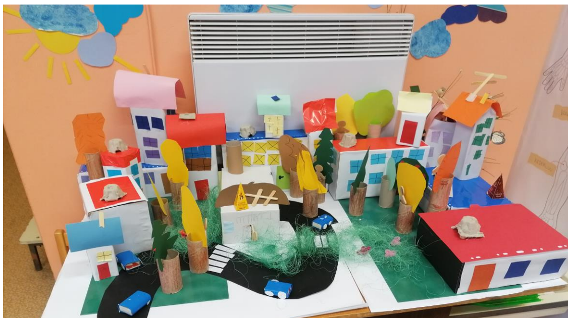
Lasteaiarühma Jõmmu laste valmistatud linnaku makett.

Jõmmu lasteaiarühma lapsed valmistasid linna maketi. Isetehtud linnak täieneb pidevalt vastavalt nädala teemadele.