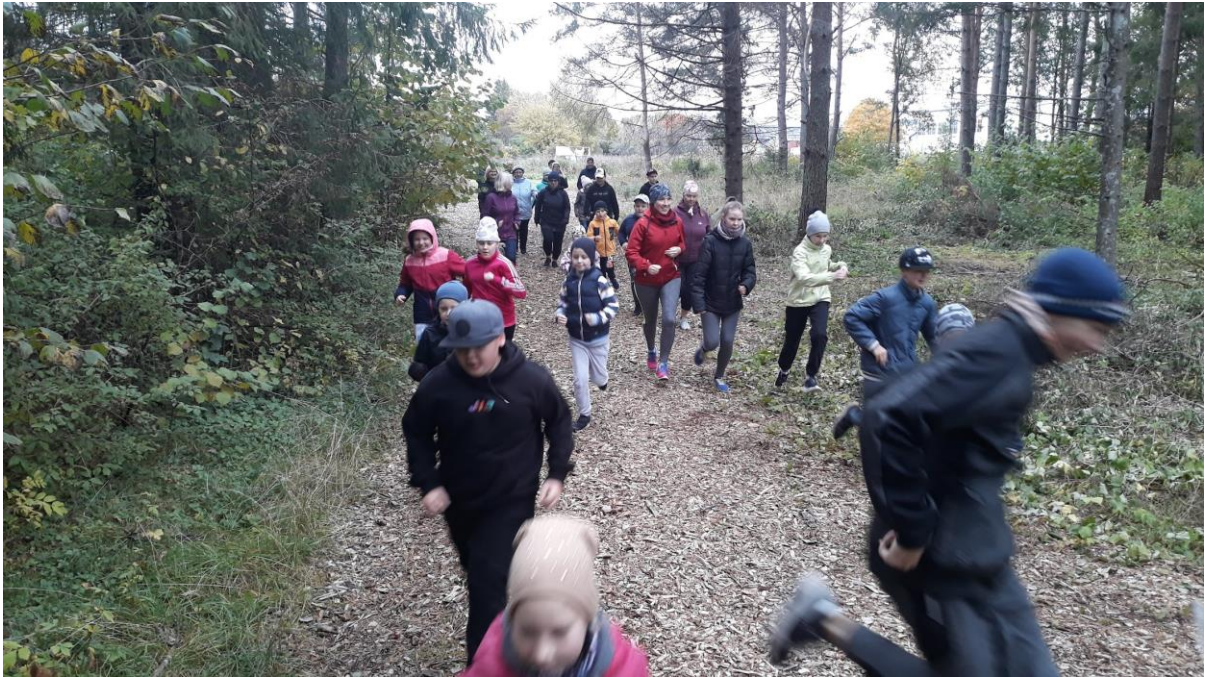
Terviseraja start.

Õpetajate päeval õnnitlesid õpilased kõiki kooli ja lasteaia õpetajaid kauni lille ja tordiga. Õpilasesinduse õpilased valmistasid õpetajatele aktiivse viktoriini. Õpetajad otsisid mööda kooli erinevaid punkte ja lahendasid vahvaid ülesandeid. Kindlasti selgusid ka nutikamad. Traditsiooniliselt 9. klassi õpilased viisid läbi õppetunde. Õpetajad aga mängisid lauamänge, vaatasid ühiselt Rapla Valla aasta õpetaja tunnustamise tseremooniat ning nautisid vabas õhkkonnas koosolemise rõõmu.