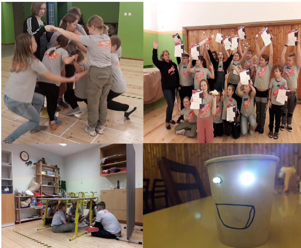
Õpilaste tegemised Rakett 69 õpihuvilaagris.

Vaatamata koolivaheajale kajas meie koolimaja laste aktiivsest tegutsemisest ja mängimisest. 27.-29. oktoobril osalesid 3.-7. klasside õpilased Kristiine Vahtramäe juhendamisel Rakett 69 õpihuvilaagris. Oli palju avastamist, uurimist ja läbi mänguliste tegevuste õppimist.