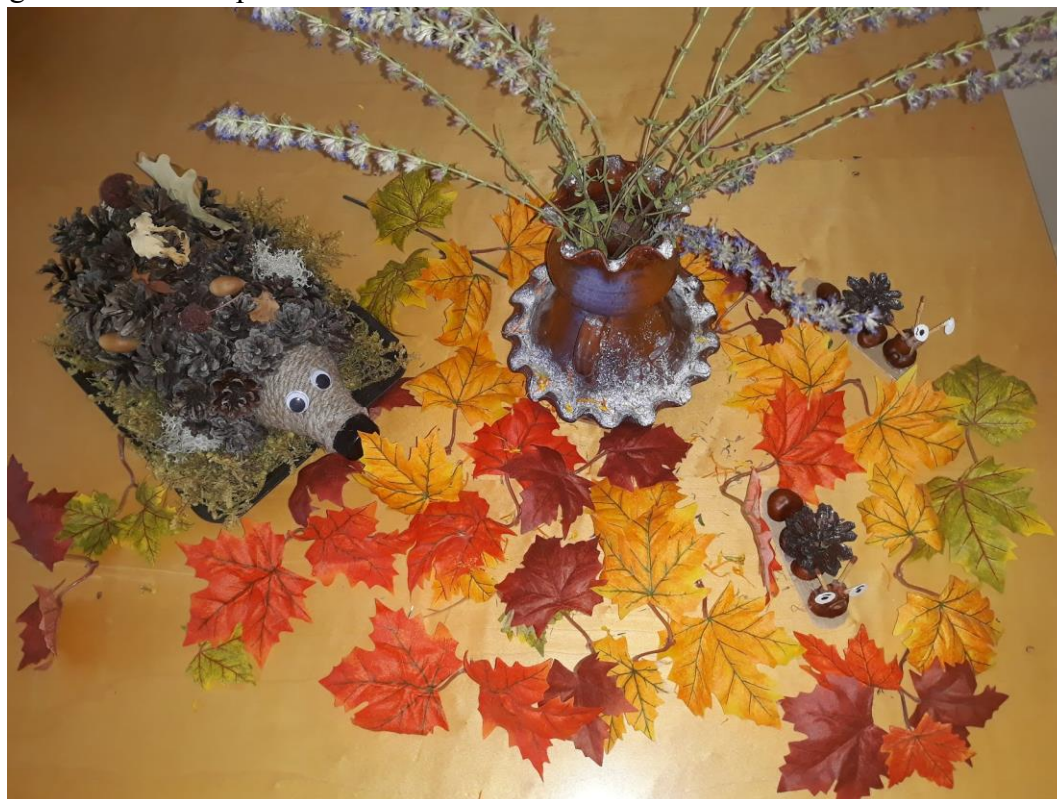
Lasteaiarühma Muumi lapsevanema meisterdatud sügiskompositsioon.

Meisterdavad ka lapsevanemad. Purku lasteaiarühmas Muumi on ühe lapsevanema valminud kaunis sügisteemaline kompositsioon.